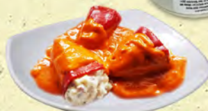
PIMIENTOS RELLENOS CON CECINA