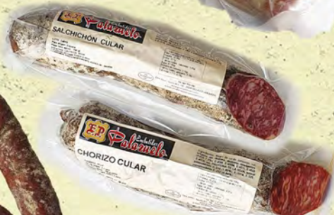
CHORIZO Y SALCHICHÓN CULAR