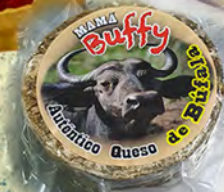
QUESO DE BÚFALA