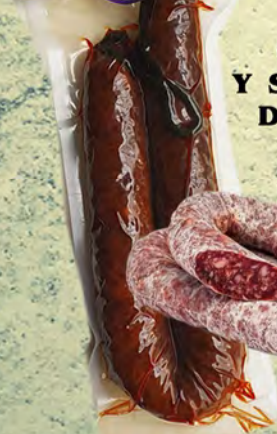
CHORIZO Y SALCHICHÓN DE GANADO DE LIDIA