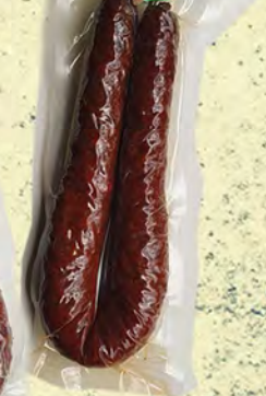
CHORIZO Y SALCHICHÓN DE CIERVO