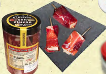
PINCHO DE CECINA Y QUESO