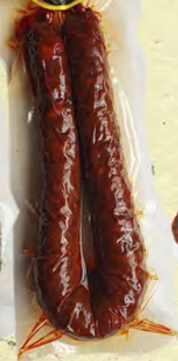
CHORIZO Y SALCHICHÓN DE JABALI