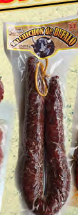
CHORIZO Y SALCHICHÓN