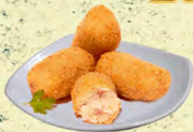
CROQUETAS CON CECINA