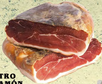
CENTRO DE JAMÓN