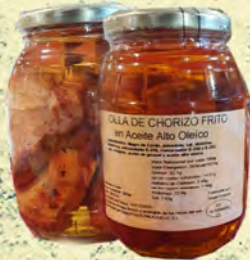
OLLA DE LOMO Y CHORIZO FRITO