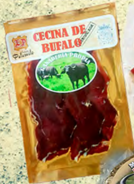
CECINA LONCHEADA Ó TACOS