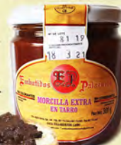
MORCILLA EXTRA DE LEÓN