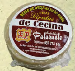
QUESO OVEJA CON VIRUTAS DE CECINA