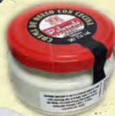
CREMA QUESO CON CECINA